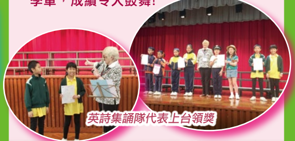
英詩集誦隊代表上台領獎

我校英詩集誦隊參加了第69屆學校朗誦節四至六年級組比賽，榮獲季軍，成績令人鼓舞!