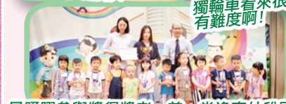
最踴躍參與獎得獎者一善一堂逸東幼稚園