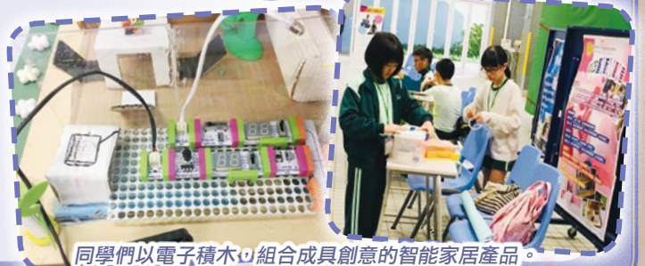
同學們以電子積木，組合成具創意的智能家居產品。