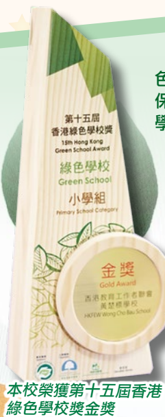
本校榮獲第十五屆香港綠色學校獎金獎

本校一直自訂環保政策及執行環境管理計劃，以達致綠色學校的目標。很榮幸，本校獲得由環境運動委員會主辦，環保基金資助的「第十五屆香港綠色學校獎」小學組別的「綠色學校金獎」。