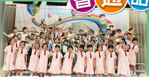
一、二年級普通話集誦隊陣容鼎盛，大家精神飽滿，信心滿滿的。

為了培養學生對學習普通話的興趣，並提升學生的自信心，本校積極鼓勵學生參與普通話朗誦比賽。今年的普通話集誦隊為我校的一、二年級學生，他們練習時積極投入，比賽當天表現出色，隊型整齊，因此勇奪第69屆香港學校朗誦節的亞軍，是一次難忘又寶貴的經驗。