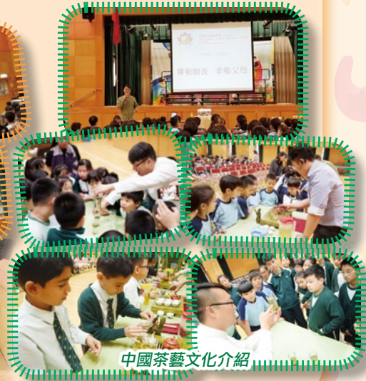
中國茶藝文化介紹