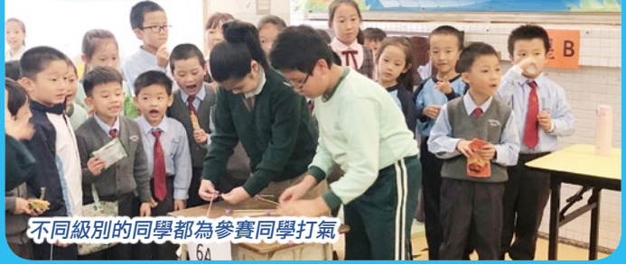
不同級別的同学都为参赛同学打气