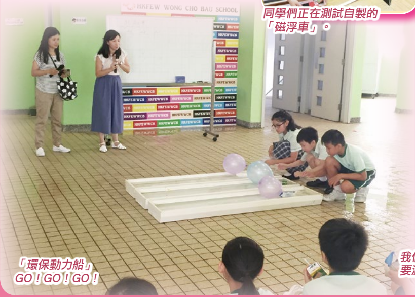
「環保動力船」GO! GO! GO!