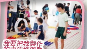
我要把我製作的車放進路軌