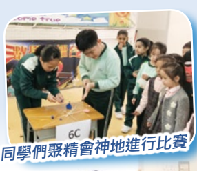
同學們聚精會神地進行比賽

本校為了提高學生學習數學的興趣，本科於今年新設立了「數學小擂台」比賽。比賽形式是首先在班內進行初賽，從中挑選優勝者參加全級數學小擂台，比賽優勝者會獲得精美獎品以作鼓勵。11月已進行了六年級的比賽，同學們都很投入，氣氛激烈。