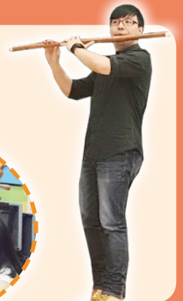
中國笛導師介紹樂器