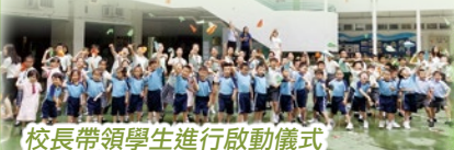
校長帶領學生進行啟動儀式