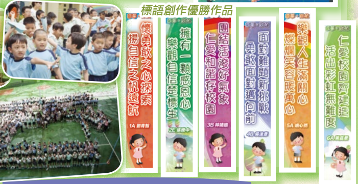
標語創作優勝作品