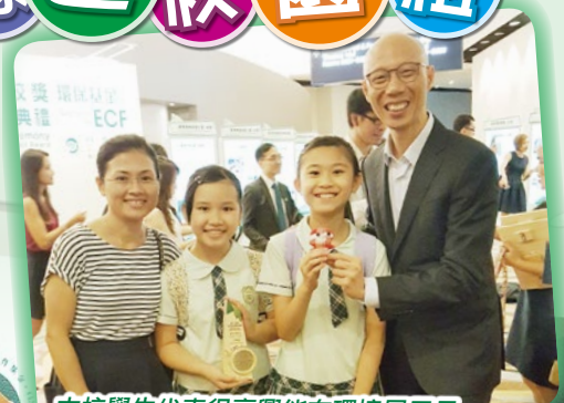
本校學生代表很高興能在環境局局長黃錦星先生手中接過金獎