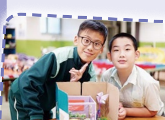
同學們的作品不但具創意，而且實際可行。