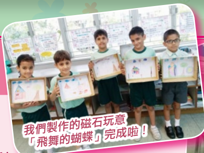
我們製作的磁石玩意「飛舞的蝴蝶」完成啦！

本科一直以來着重培養學生的科學探究精神，故每學年都會為各級舉行不同的科學探究活動，期望學生在「動手做」及競賽的過程中學習科學知識。