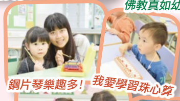
鋼片琴樂趣多！我愛學習珠心算

為提升幼童的學習興趣，發展學生的多元智能，本校於10月至12月期間舉行《啟蒙資優課程》。課程包括：健體小先鋒、樂拼ABC、齊來快樂學珠心算、創意藝術坊和叮叮噹噹鋼片琴，發掘幼童的興趣。