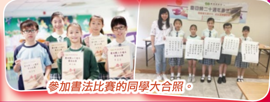
參加書法比賽的同學大合照。