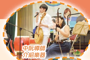
中阮導師介紹樂器

為了加強學生對中國音樂文化的認識及提升其興趣，本校特意安排了各中樂樂器班的導師進行演出。