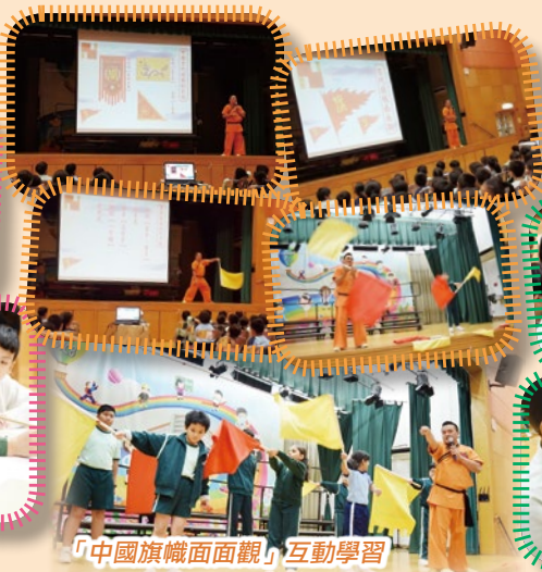
「中國旗幟面面觀」互動學習