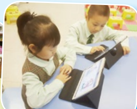
同學們上英文課時利用Raz-Kids內的書本進行分享閱讀 (Shared reading) 及個人閱讀 (Independent reading)