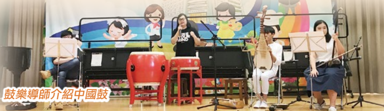
鼓樂導師介紹中國鼓