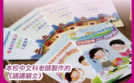
本校中文科老師製作的《誦讀韻文》

為提升學生對中國詩文的認識，加強學生對中國韻文的興趣，本校特別製作了一本《誦讀韻文》，讓學生一同分享閱讀古詩文的樂趣。