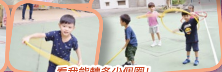
看我能轉多少個圈！