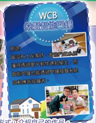
同學們以海報形式介紹自己的作品。