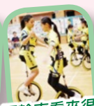
獨輪車看來很有難度啊！