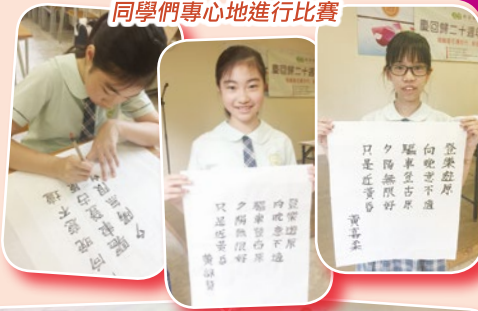
同學們專心地進行比賽

書法是中國重要的傳統文化，是表現漢字形體的藝術，我校除了在課堂上進行書法教學外，亦鼓勵學生參與校外書法比賽。今年，本校同學在慶回歸20週年書法比賽(毛筆組)中獲得佳績，可喜可賀!