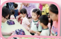
將「江山如此多FUN」放進AR，真好玩！邊玩邊學！

2017年9月16日，由本校舉辦的《幼兒STEAM嘉年華》經已完滿結束，活動當日吸引了不少家庭參與，場面非常熱鬧。嘉年華主題圍繞科學、科技、工程、藝術和數學元素，希望能從小培養小朋友對STEAM的興趣，從而培訓學生的邏輯思維及解難能力。當天，小朋友們都玩得特別開心和投入。