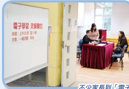
不少家長到「電子學習支援攤位」尋求支援

利用電子學習是大趨勢，但很多家長在安裝及使用電子學習軟件時，都會遇到一定的困難。為了支援家長，本校特別在家長日舉辦了「電子學習支援攤位」，即場為家長下載各科的教學軟件及解決學生的登入問題。如各位家長遇到困難，歡迎在辦公時間到校尋求支援。