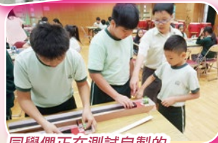
同學們正在測試自製的「磁浮車」。