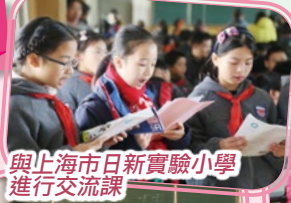
與上海市日新實驗小學進行交流課

為了提高學生對中華文化的興趣，增強國民身分認同。本校學生於12月7日至9日參加「同心同根」——香港初中及高小學生內地交流計劃，藉此深入了解上海的發展與規劃。