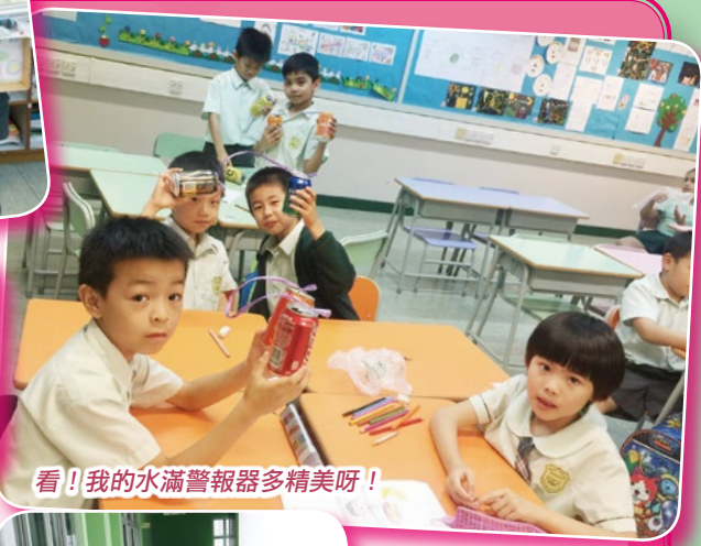
看！我的水滿警報器多精美呀！