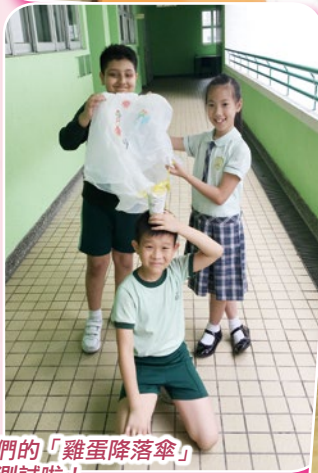
我們的「雞蛋降落傘」要測試啦！