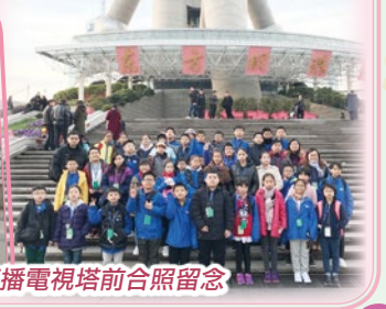
在上海東方明珠廣播電視塔前合照留念