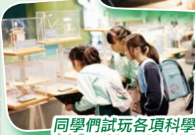
同學們試玩各項科學展品